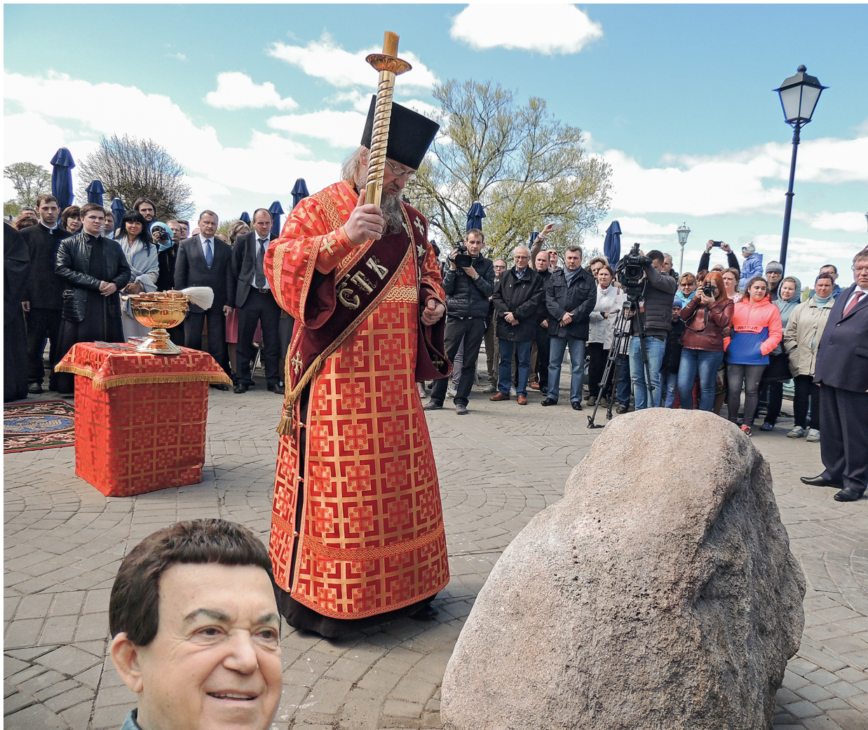
Почетный гость фестиваля Народный артист СССР Иосиф Кобзон