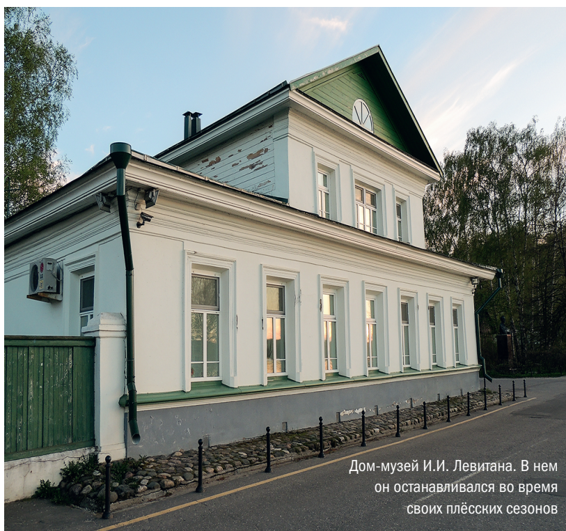
Дом-музей И.И. Левитана. В нем он останавливался во время своих плёских сезонов

У Беларуси и России много общего, роднит их интересы и с давних пор почитаемые в наших странах возделывание и обработка льна. Привередливая и трудоемкая эта культура, веками кормившая и одевавшая крестьян, в наше время угодила в не лучшие для себя времена. В СССР сделали было ставку на хлопок, финансируя его выращивание в Средней Азии. Потом Узбекистан и его соседи стали заграницей, и текстильщикам пришлось призадуматься. Думать приходится до сих пор.