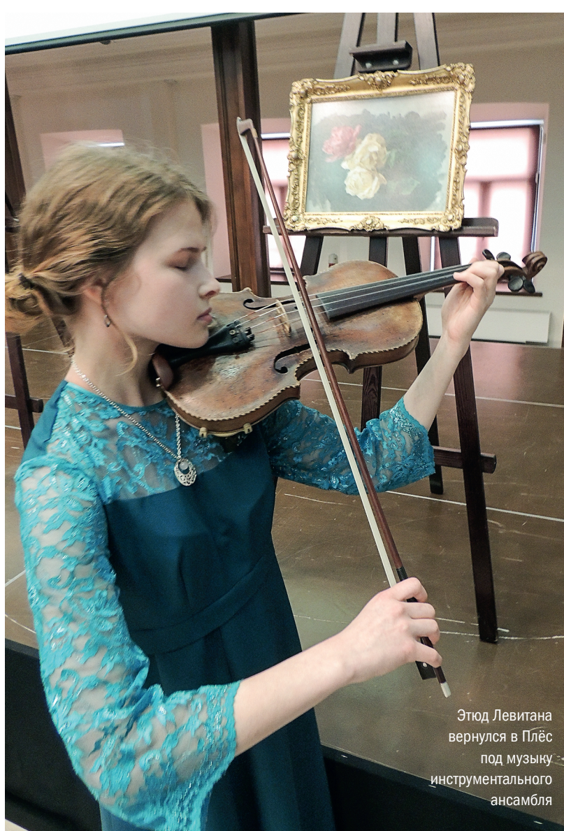
Этюд Левитана вернулся в Плесь под музыку инструментального ансамбля