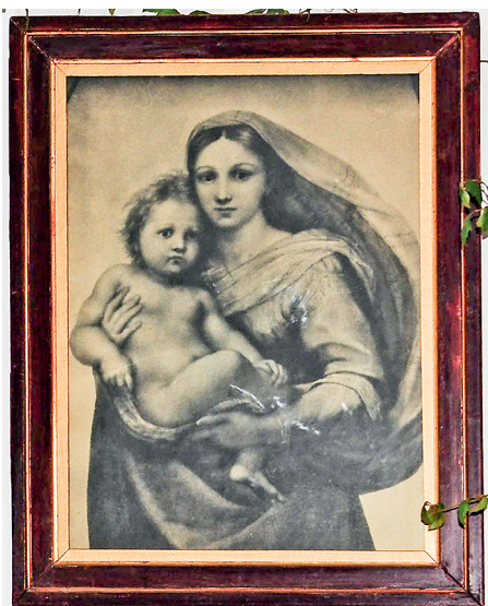
Экспонаты ярославского дома-музея: копия «Сикстинской Мадонны» Рафаэля, подаренная Максимом Горьким, и сборник стихов Максима Богдановича «Вянок» (на белорусском языке)