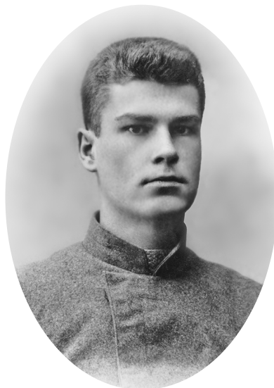
Классик белорусской литературы, поэт Максим Богданович

узким ремешком. Богданович пред- ставился и передал письмо. Писа- тель вскрыл его и, улыбаясь, про- читал: «От Сладкого к Горькому»... «Вы белорус? – поинтересовался Горький. – Ну вот... Вот это хорошо. Здорово принадлежать маленькому народу вроде вас, белорусов... Мож- но все изучить – и природу страны, и жизнь, и прошлое, и настоящее... Тогда легче писать...»